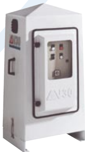
CJC VacuumFilter V30