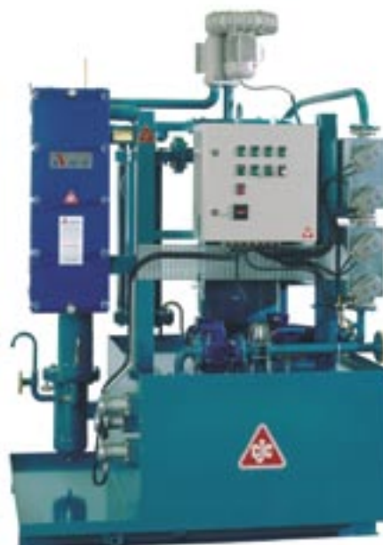
CJC Desorber D38