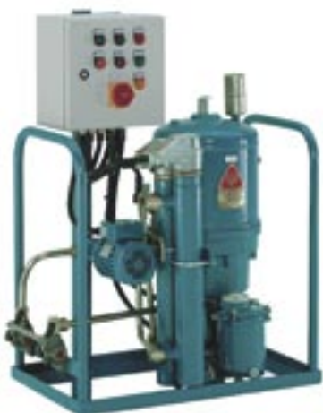
CJC FilterSeparator PTU2 27/27 PV-EPW