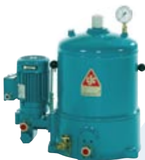
CJC FineFilter HDU 27/27 P