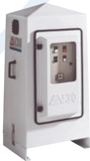
CJC VacuumFilter V30