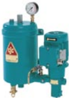
CJC FineFilter HDU 15/25 PV