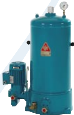
CJC FineFilter HDU27/54 GP-EPT