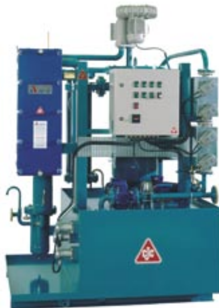
CJC Desorber D38