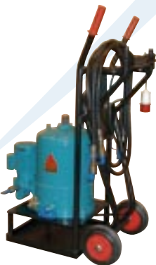
CJC FineFilter HDU 27/27 P-EM